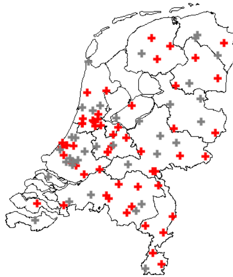
Figuur 2.1 Een overzicht van de SEH's die hebben deelgenomen aan de vuurwerkregistratie (de rode markeringen)